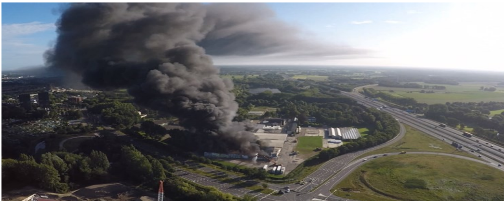
Luchtfoto op 3 april van de brand aan de Caledoniastraat 13, Tilburg, waar de brand nog woedde.

“Ondanks alle goede training en professionaliteit kon deze ramp niet voorkomen worden, het juiste materieel en het beste personeel was ingezet. Een milieustraat bevat nu eenmaal vele onvoorziene omstandigheden. “, aldus de brandweercommandant van het Tilburgse korps.